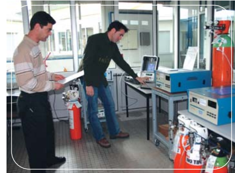
Laboratoire interrégional d'étalonnage à l'ORAMIP